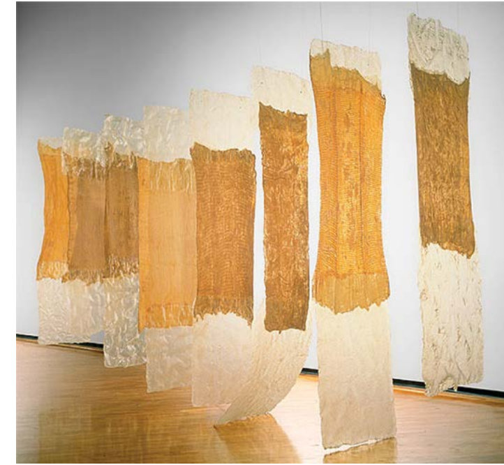
Kuva 2. Eva Hesse, Contignant 1969. 6

Hiljaisuus taiteessa on pysäyttävää. Jotain, joka parhaimmillaan lähestyy yhtä aikaa ei-mitään ja kaikkea. Eva Hessen (1936–1970) teoksen Contignant olemus viestitti aikoinaan henkäyksenomaista hiljaisuutta, liki erakoitumisen kaltaista sisäänpäin kääntyneisyyttä. Jyrki Siukonen (s.1959) kuvaa kirjassaan Vasara ja hiljaisuus , että se, mitä Contignant välitti taidemaalmaan oli julistus ekspressiivisestä voimasta materiaalissa itsessään, materiaalin, joka pidetään sanoin ilmaiseuttoman tasolla.” [...] ääni joka puhui Contignant -teoksen kuvan läpi välitti viestin yksityisyydestä, erkaantumisesta kielestä, vetäytymisestä niihin äärimmäisen henkilökohtaisiin kokemuksiin, jotka ovat puheen saavuttamattomissa tai sen tuolla puolen. [...]” 4