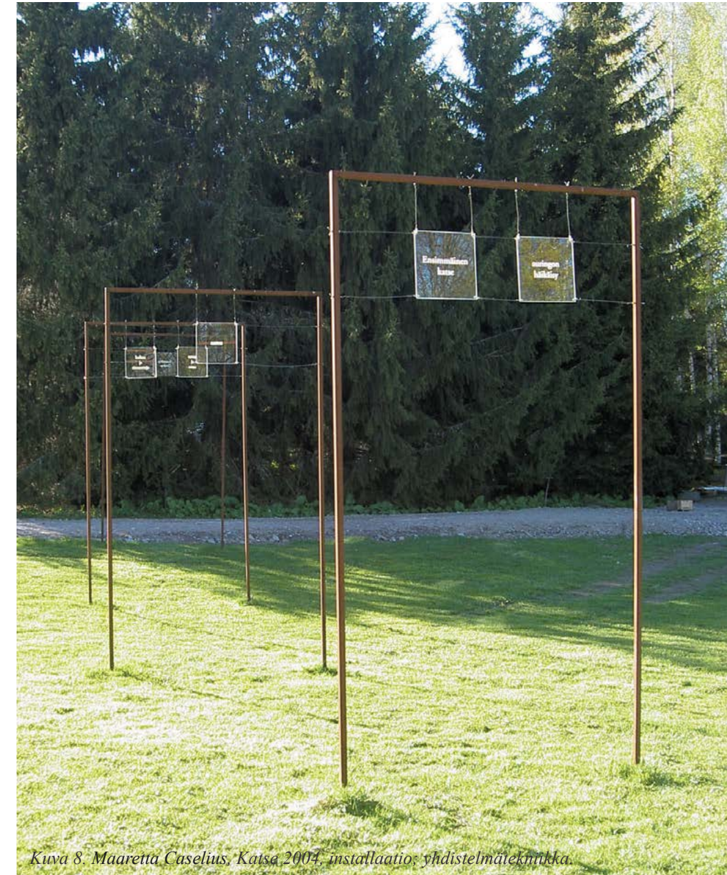
Kuva 8. Maaretta Caselius, Katse 2004, installaatio: yhdistelmätekniikka.