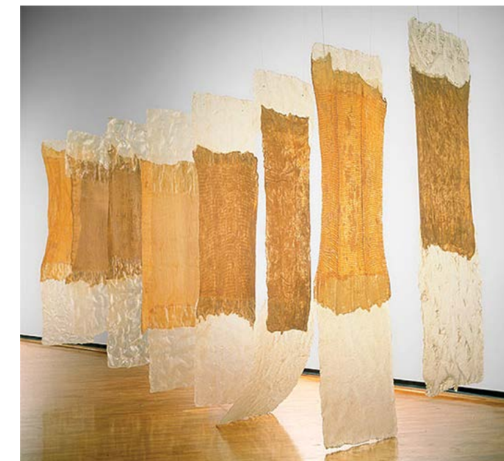
Kuva 2. Eva Hesse, Contignant 1969. 6

Hiljaisuus taiteessa on pysäyttävää. Jotain, joka parhaimmillaan lähestyy yhtä aikaa ei-mitään ja kaikkea. Eva Hessen (1936–1970) teoksen Contignant olemus viestitti aikoinaan henkäyksenomaista hiljaisuutta, liki erakoitumisen kaltaista sisäänpäin kääntyneisyyttä. Jyrki Siukonen (s.1959) kuvaa kirjassaan Vasara ja hiljaisuus , että se, mitä Contignant välitti taidemaalmaan oli julistus ekspressiivisestä voimasta materiaalissa itsessään, materiaalin, joka pidetään sanoin ilmaiseuttoman tasolla.” [...] ääni joka puhui Contignant -teoksen kuvan läpi välitti viestin yksityisyydestä, erkaantumisesta kielestä, vetäytymisestä niihin äärimmäisen henkilökohtaisiin kokemuksen uomiin, jotka ovat puheen saavuttamattomissa tai sen tuolla puolen. [...]” 4