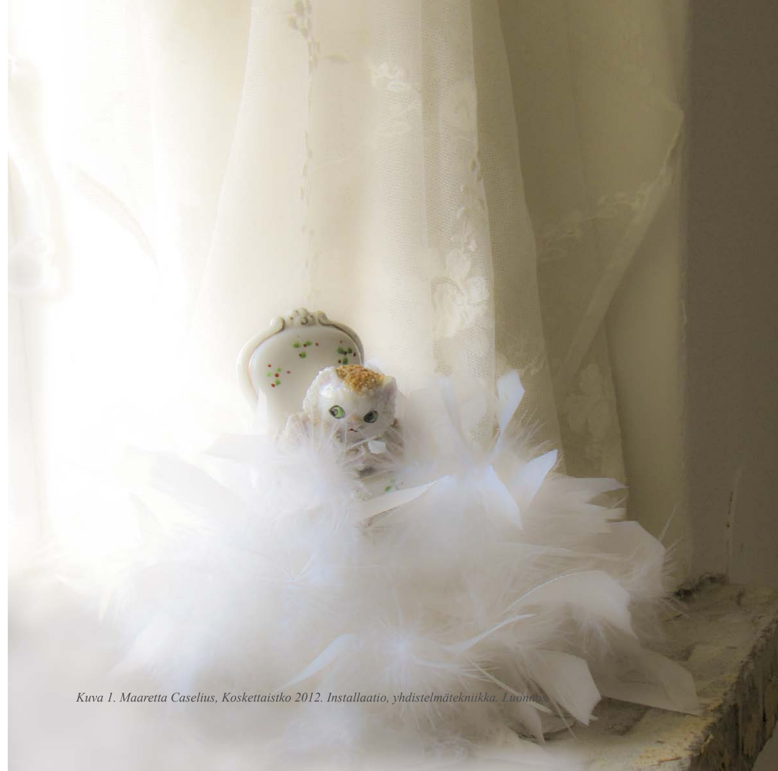
Kuva 1. Maaretta Caselius, Kosketaistko 2012. Installaatio, yhdistelmätekniikka. Luomus