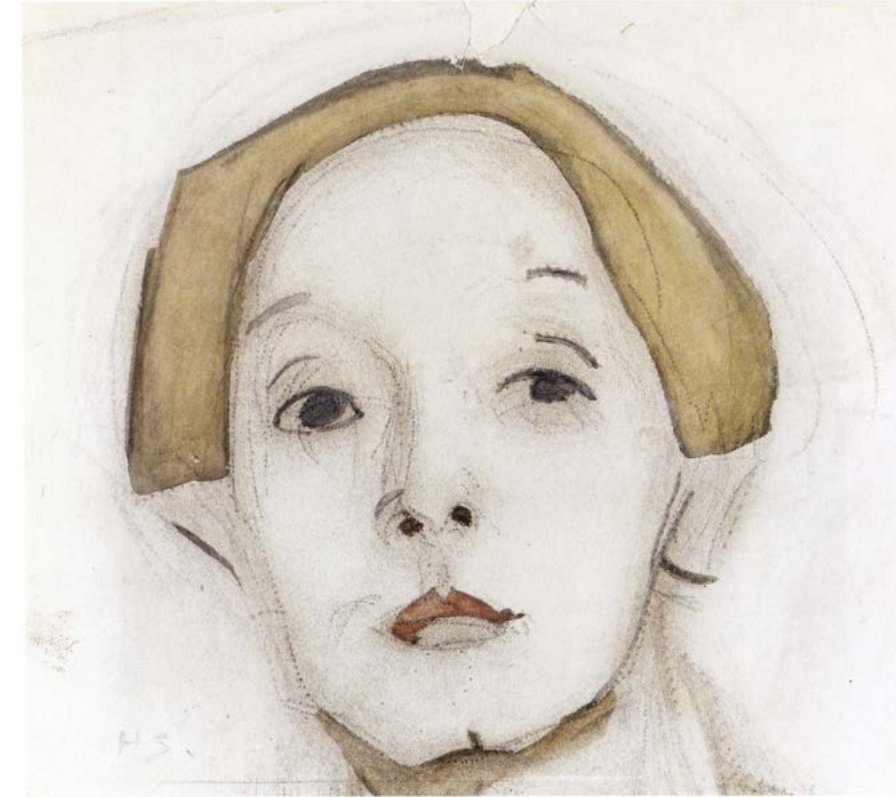
Kuva 5. Helene Schjerfbeck, Omakuva, luonnos, 1915. 28