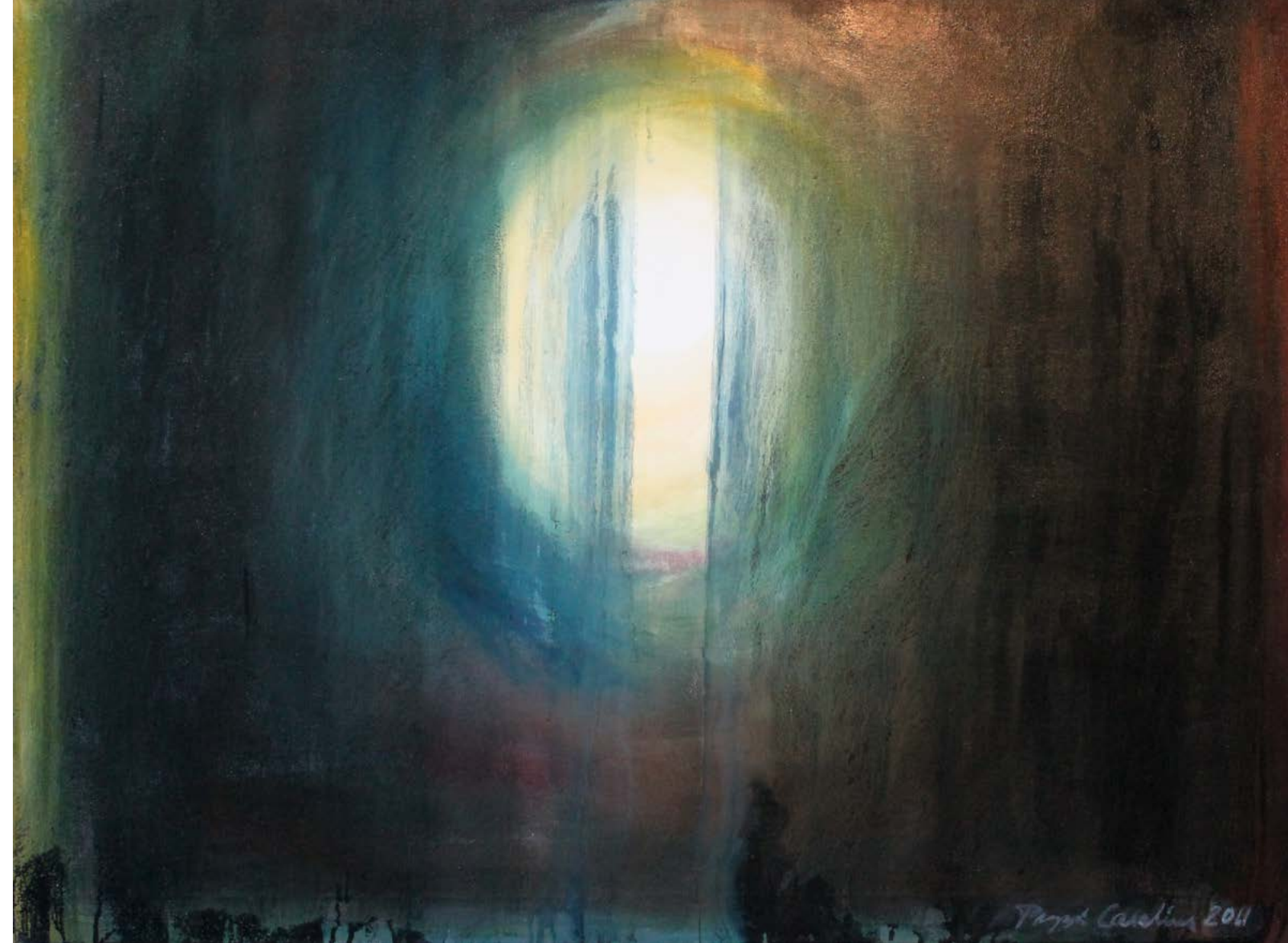
Kuva 6. Maaretta Caselius, Toiveikas 2011, öljy, tempera.

Aloitin maalaamisen munatemperalla ja vain valkoisella pigmentillä. Sitten hyvin vaaleaa keltaista, ja vähitellen lisäsin värin voimaa. Ensimmäisen päivän maalattuani kankaallani oli useiden värien vuoro-