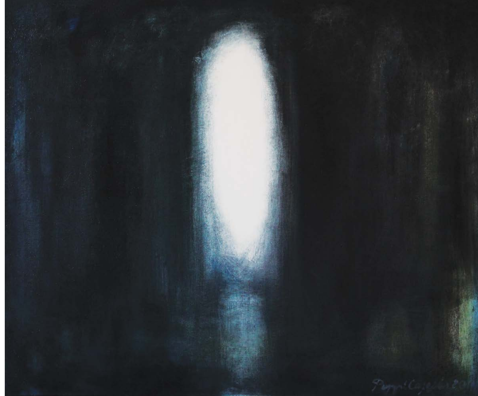
Kuva 7. Maaretta Caselius, Aika hiljaa 2011, öljy, tempera.